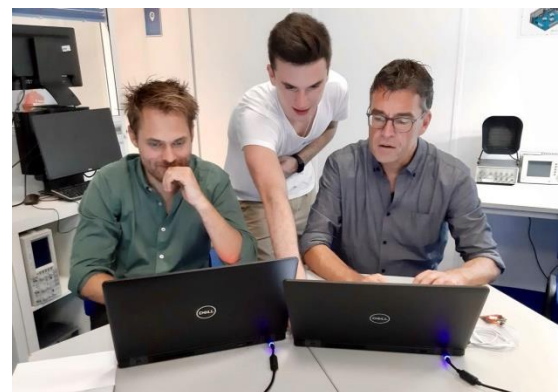
ZaB mit dem österreichischen Kollegen beim Programmieren der micro:bits

ATEC nimmt die Prüfungen nach den deutschen Kammerstandards ab und hat uns gezeigt, wie es gelungen ist, diesen Qualitätsansatz bei ATEC zu etablieren und sich und den Schülern damit einen besonderen Wettbewerbsvorteil zu verschaffen. Zudem wurden wir Lehrende als Versuchskaninchen mit dem micro:bit Programmieransatz praktisch vertraut gemacht. Innerhalb von kürzester Zeit erlernten wir Ansätze des Lehransatzes, der nicht nur für technische Lernbereiche, sondern auch in Mathematik, den Sprachen oder sogar in Fächern wie Geschichte eingesetzt werden kann.