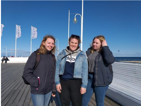
An der Ostsee

Unsere Gastgeschenke, Taschen der Schülerfirma von Crea Inklusivo und Handcremes der PK Kosmetik, kamen auch sehr gut an.