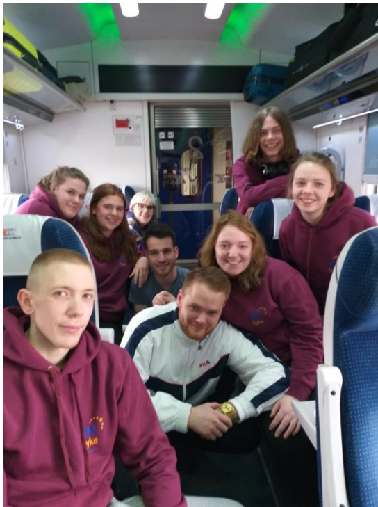
BBS-Team für Torun (in Kapuzenshirts von Print and Design, gefördert vom FöBBS)