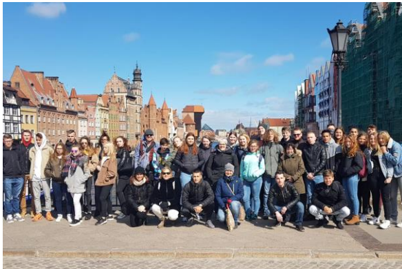
Die ganze Erasmus+ Gruppe vor der Danziger Skyline